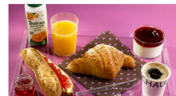
*dans la limite des stocks disponibles